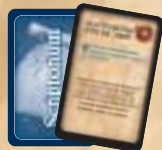
24 Scriptorium kaarten