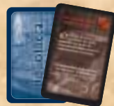
8 Bibliotheca kaarten