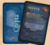
6 Crypta kaarten